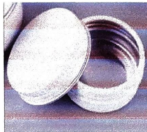
รูปแบบตลับบรรจุภัณฑ์