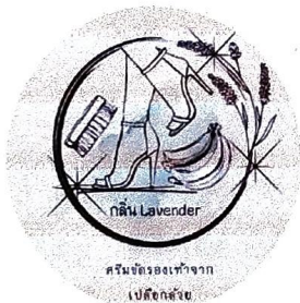
รูปแบบโลโก้